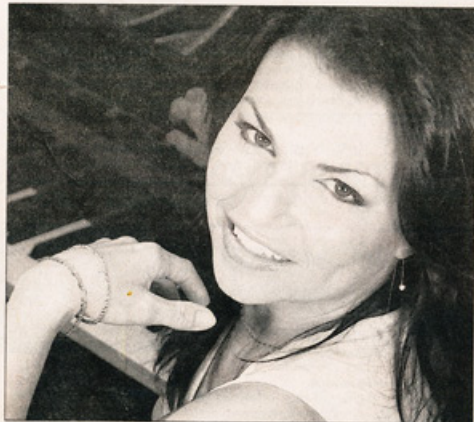
La soprano Sabrina Ferland partagera la scène de Bernard Lachance, à Chicago, demain soir.